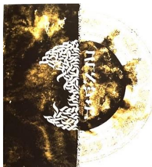
Jüdische Geschichte Band 1