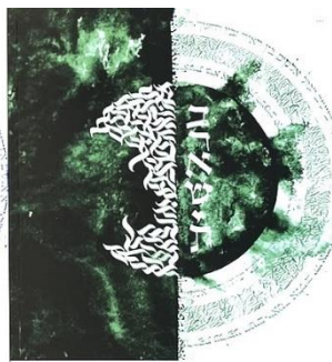
Jüdische Geschichte Band 3