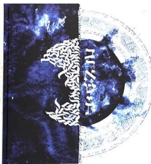
Jüdische Geschichte Band 2